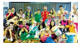
サルサガムテープ