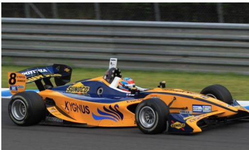
Team KYGNUS SUNOCO (Team LeMans)

この他、キグナス石油がスポンサードする国内トップフォーミュラのスーパーフォーミュラで活躍するチーム キグナス スノコ（チームルマン）の車両の展示&試乗会（走行せず運転席の試乗のみ）を開催します。