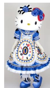
ハローキティ